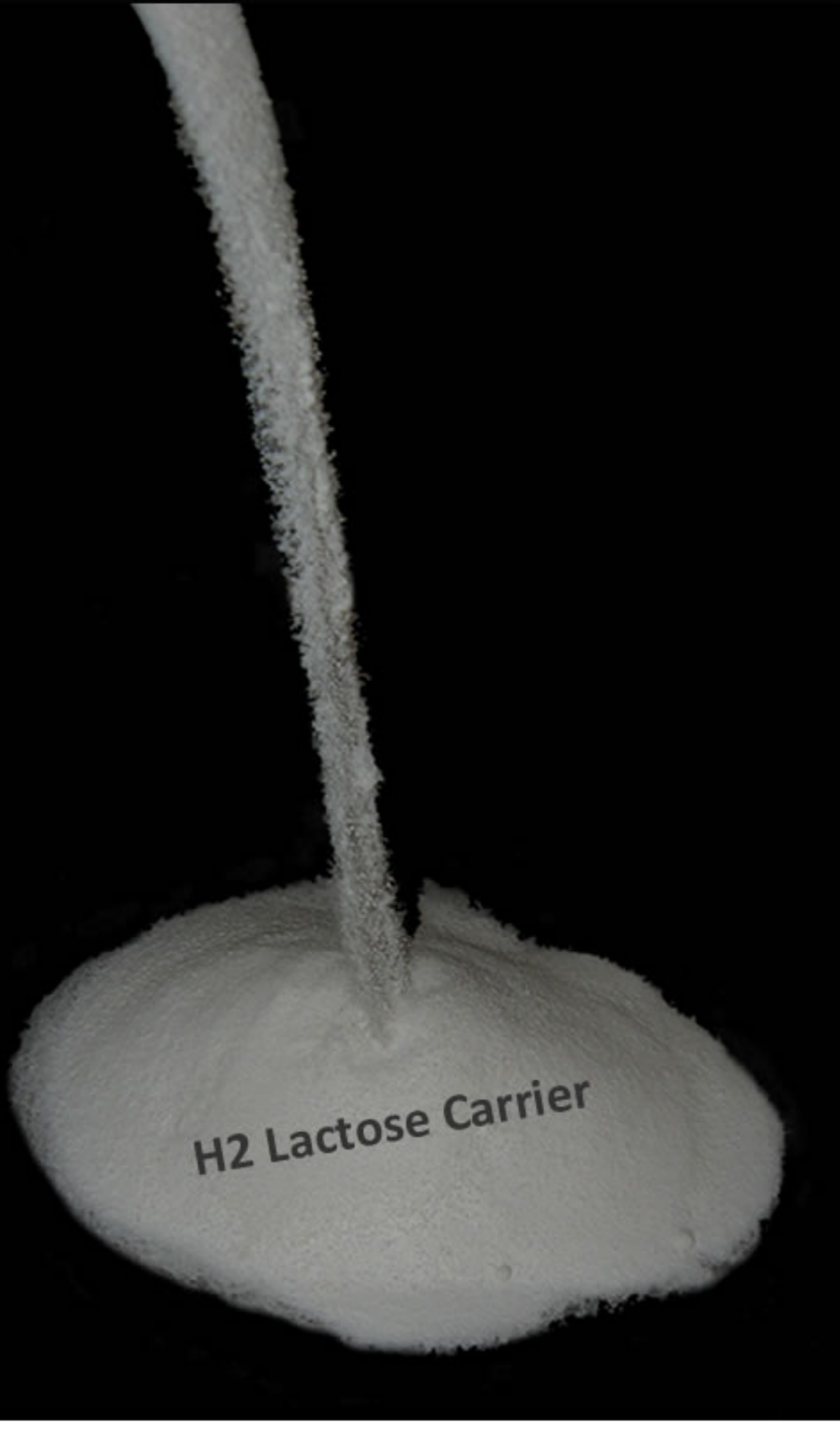
بیوتین با کریر لاکتوز